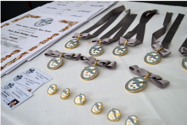
Mesa con los lazos, veneras, diplomas...