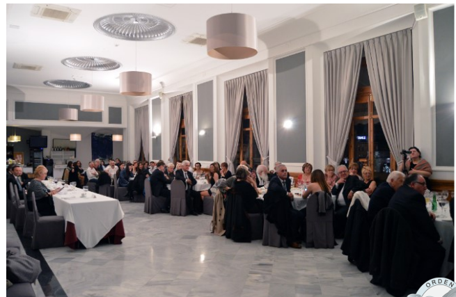
Vista general de la sala