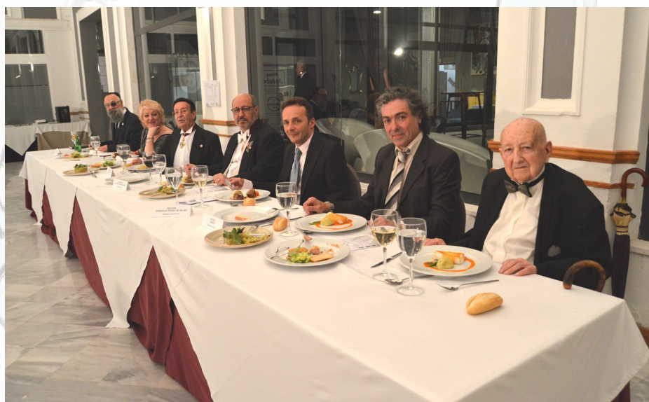
Mesa Imperial en la III Cena de Gala de la Orden Poético-Literaria Juan Benito.