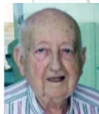
VICENTE REBOLLAR CERDÁ

Por su dilatada carrera pictórica en la cual ha expuesto sus obras en todo el mundo y su cotización como pintor está constantemente al alza.