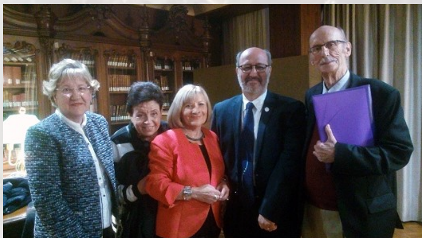
Foto con los presidentes de las entidades participantes.

La visita turística concluyó con una comida de hermandad, la cual fue muy recibida por todos.