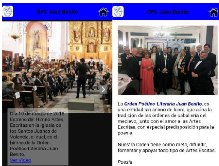
A la izquierda. Pantalla principal de la aplicación.