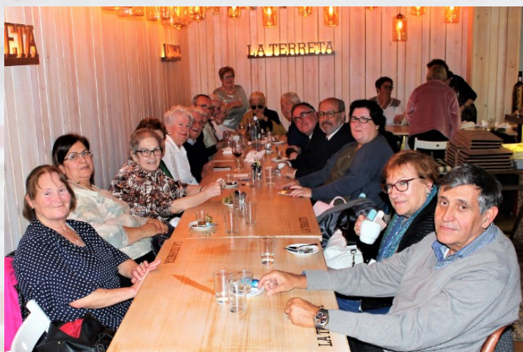
Comida de Hermandad.