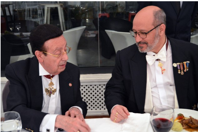
Departiendo durante la cena