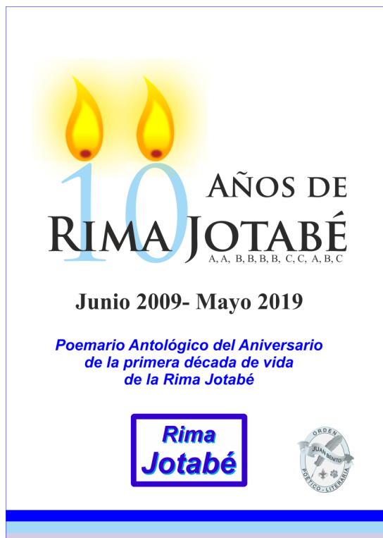
Portada del poemario 10 Años de Rima Jotabé