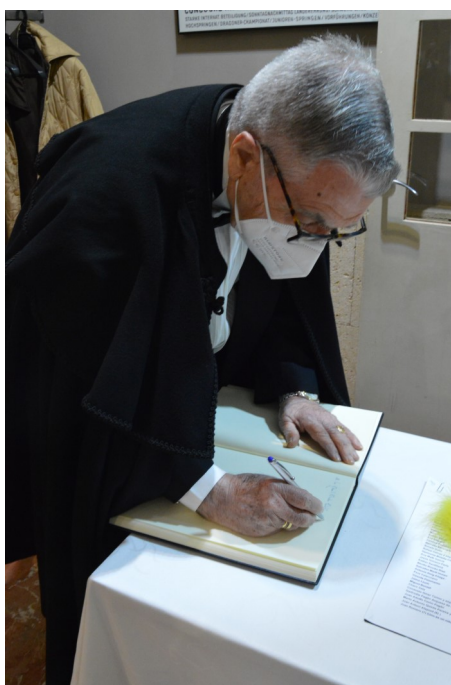
Firmando el Libro de Honor