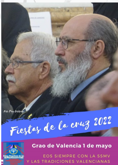
Fiestas de la Cruz de El Grao