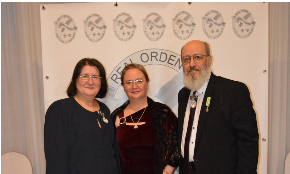
Parte del equipo de la Real Orden