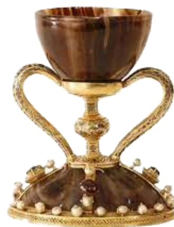
Santo Grial de Valencia

Así que os pido humildemente que, seáis embajadores de vuestra