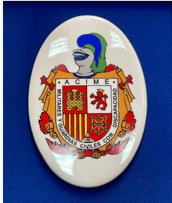
Escudo de la Asociación