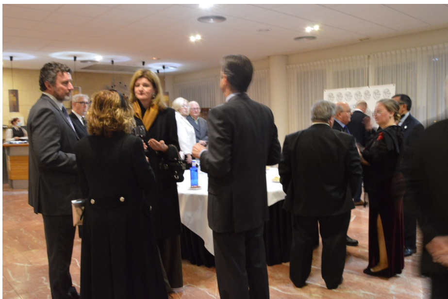
Un momento del cóctel