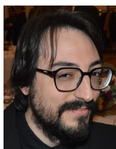
Parte del equipo de la Real Orden Poético-Literaria Juan Benito