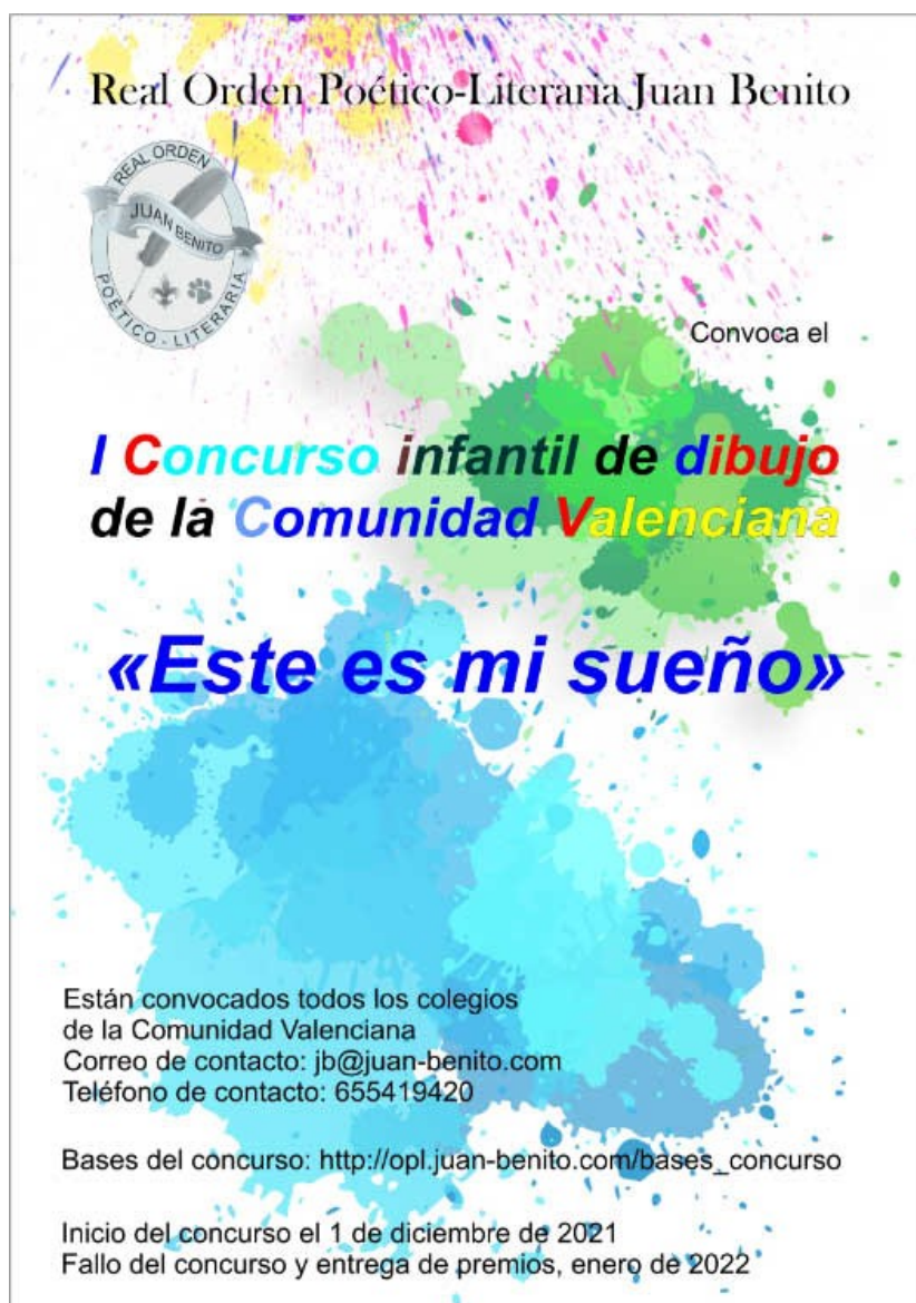
Cartel anunciador del concurso

mos efusivamente las gracias por su participación y ben hacer.