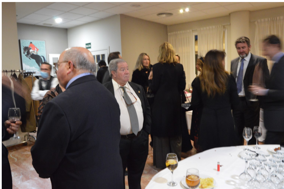
Durante el cóctel