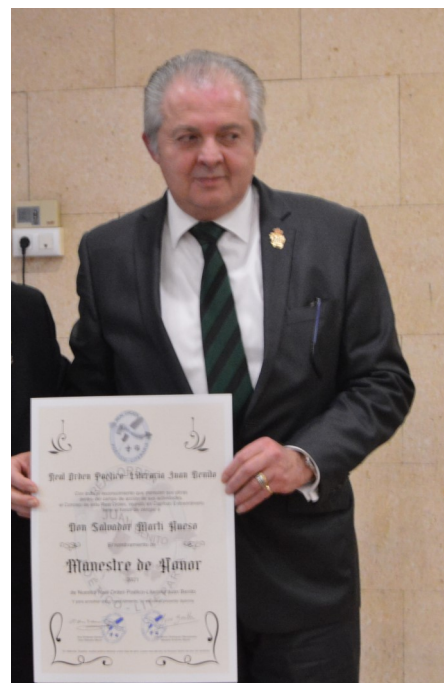
Con su diploma en la mano