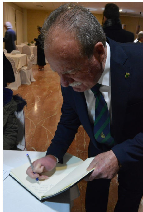
Firmando el Libro de Honor