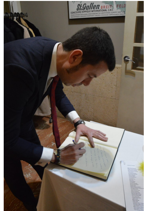
Firmando el Libro de Honor