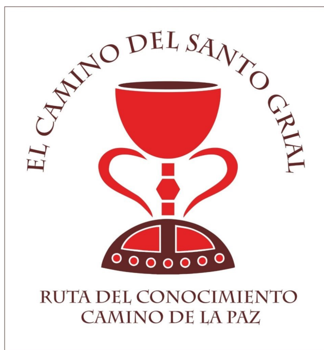
Logotipo de la asociación El Camino del Santo Grial

No es una reliquia ganada a sangre y fuego, no es una reliquia ganada a base de espolio, sino que es una reliquia que la tradición dice que vino de mano en mano. Entonces es curioso porque cuando desarrollo mi doctorado en el año 2019, todo aquello que podía quedar en una tierra de nadie, incluso aquello que alguien