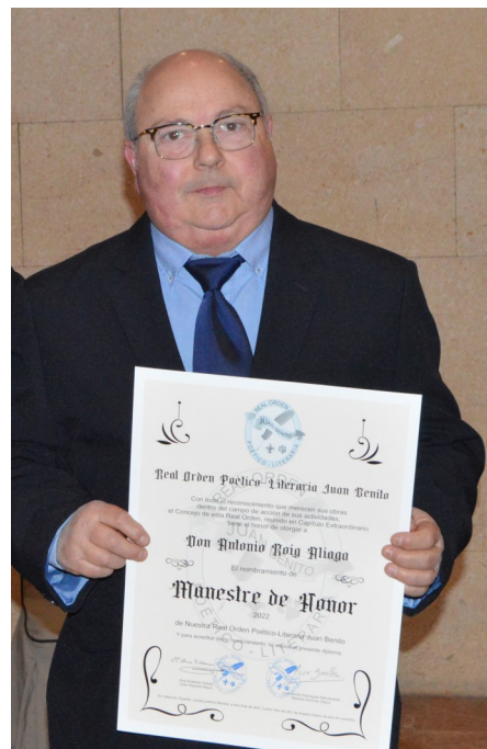
Luciendo su diploma