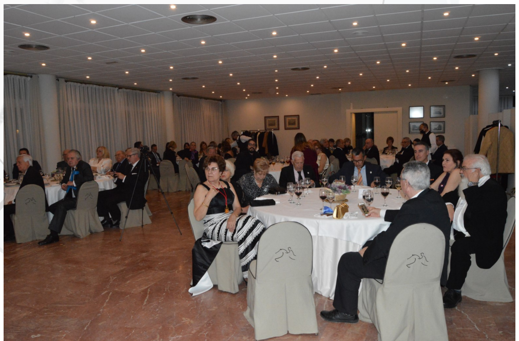
Una panorámica del acto