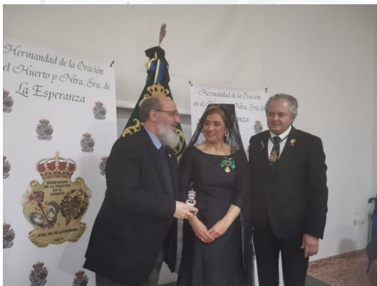
Traslado de la imagen titular de la Hermandad de la Oración en el Huerto y de Nuestra Señora de la Esperanza y del Santo Cáliz de Alboraya