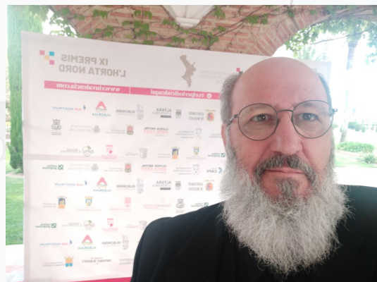
Entrega de los IX Premios de l'Horta Nord de El Periódico de Aquí