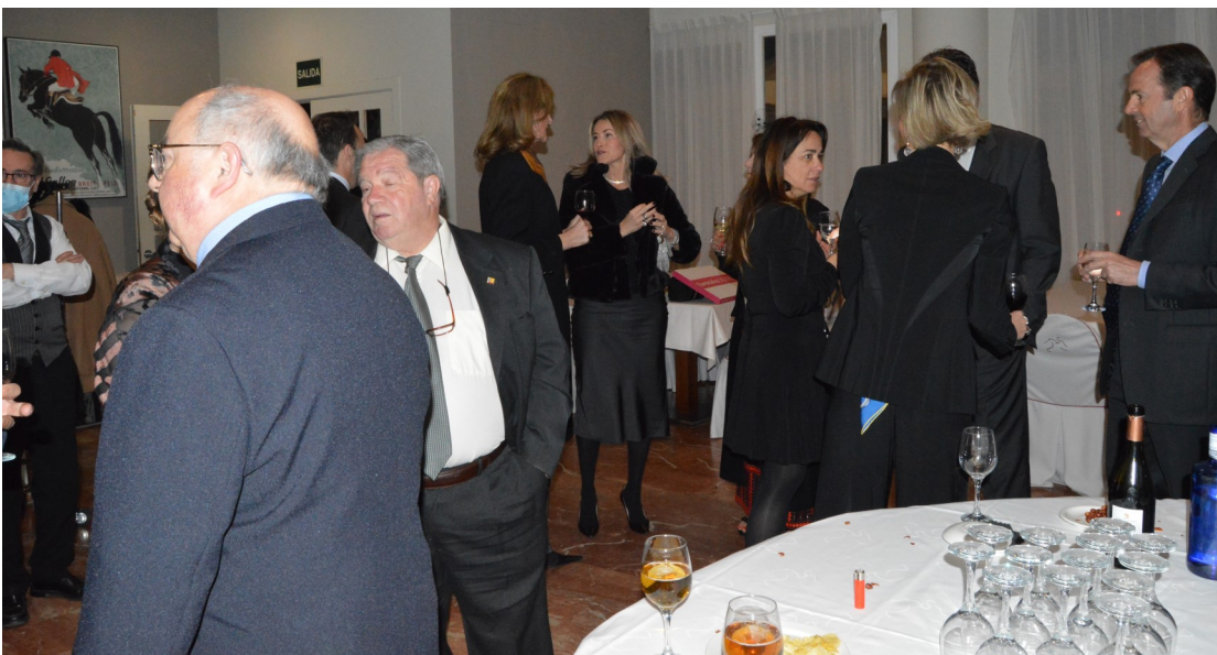
Durante el cóctel