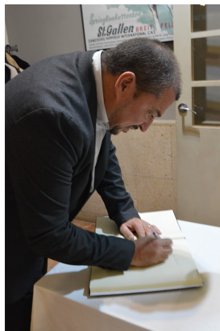
Firmando el Libro de Honor