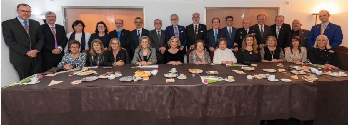
Cena tras el Pregón del inicio de las fiestas del Santísimo Cristo del Grao